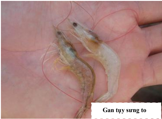
Gan tụy sưng to

Tôm bệnh chết trong giai đoạn sớm từ 07 – 35 ngày thả nuôi, tuy nhiên tôm cũng bị bệnh này vào các giai đoạn 35 – 60 ngày tuổi. Bệnh thường diễn ra vào mùa mưa nhiều hơn mùa nắng.