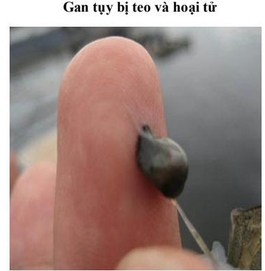
Gan tụy bị teo và hoại tử