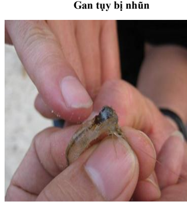
Gan tụy bị nhũn